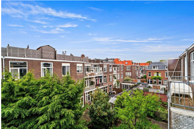
1e Braamstraat 15C, 's-Gravenhage