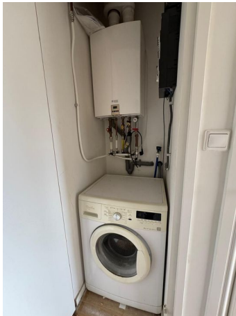
Nieuwe Molstraat 20 G, 's-Gravenhage