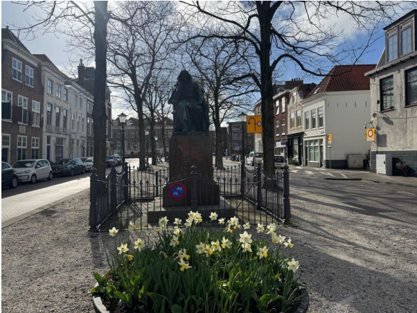
Nieuwe Molstraat 20-H, Den Haag