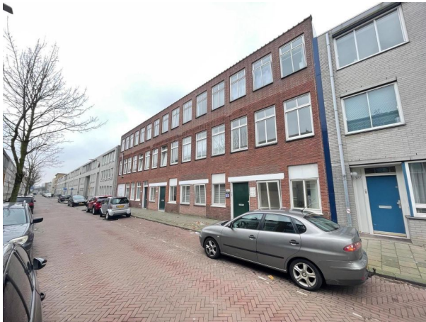
Paulus Potterstraat 179, 's-Gravenhage