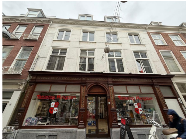
Korte Houtstraat 11 G, 's-Gravenhage Woning