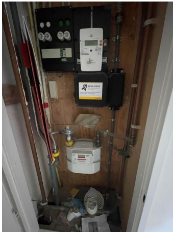
Kranestraat 52 A, 's-Gravenhage