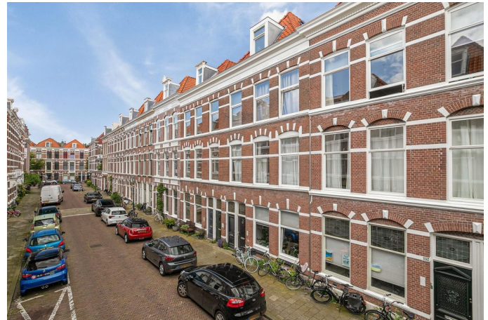
Van Bylandtstraat 163-C, Den Haag