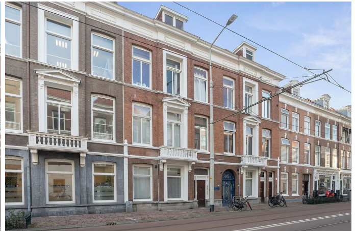
Zoutmanstraat 48 N, 's-Gravenhage