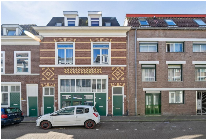
Kranestraat 35 C, 's-Gravenhage Situatietekening