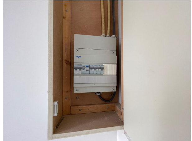
De Perponcherstraat 27, Den Haag