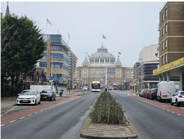
Boschestraat 6-C, Den Haag