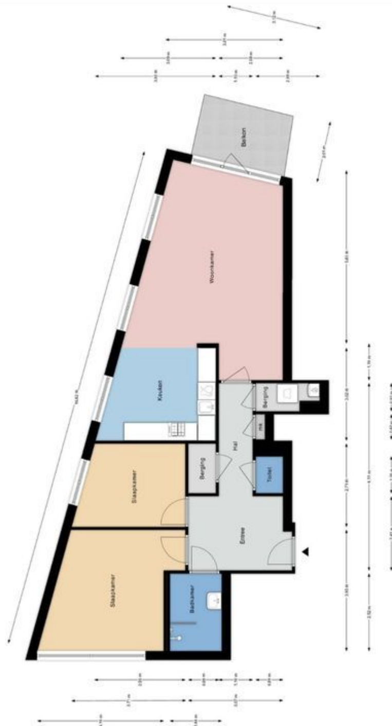
Steijnlaan 288, Den Haag | 5e Verdieping H = 2.39 m

Elzenaar NVM Makelaars & Hypotheken is met 3 kantoren centraal gevestigd in Den Haag