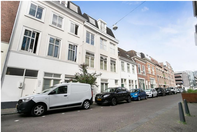
Kranestraat 43 B, 's-Gravenhage